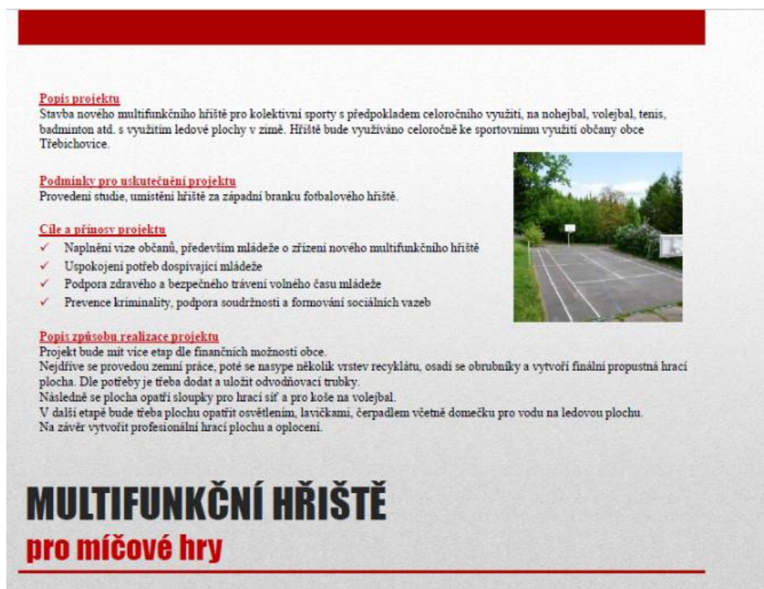
Obr. 2: Výpis ze Strategického plánu obce