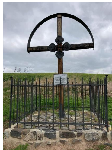
Kovářská práce – Standa Čumbál Sacký

Lípa žije dlouho, řadu století, a zdobí každou krajinu, byť už je věkem zkroušená a vykotlaná.