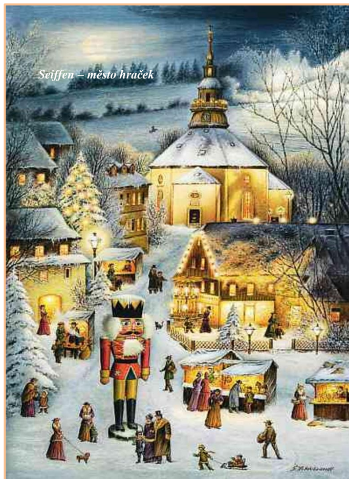
Seiffen – město hraček

Těm, kterým nemoc nedovolila na poslední chvíli vyrazit, slibujeme, že příští rok budou mít zase příležitost, protože adventní trhy mají své kouzlo a je škoda nečarovat. Takže na viděnou napřesrok. mj