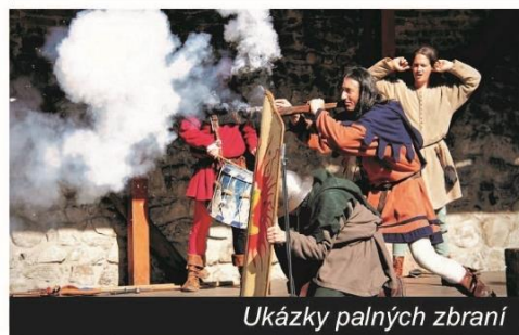
Ukázky palných zbraní