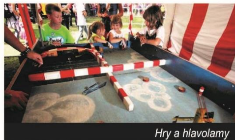
Hry a hlavolamy